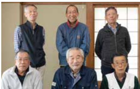
つくだちいきかつどうきょうぎかい 佃地域活動協議会のみなさん