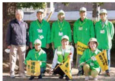
「こども安全見守り隊」のみなさん

ない横だ ん歩道や、 車や自転 車がたくさん通る場所に立っ て、通学を見守ります。こども たちが一日を無事にすごせる ようにとねがいがながら「おはよ うございます」「行ったらっ