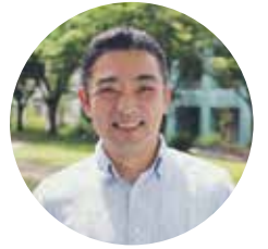
かんしゅうしゃ 監修者