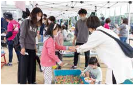
もぎ店はこどもたちに大人気