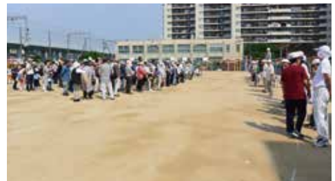
「佃ふれあいウォーク」にはたくさんの人が 参加します

です。佃 ふれあい ウォーク では、ひ なん場所 や公園、 神社など を 通り、佃 地域を一回 りします。 2時間く らい歩くので、体力作りにも役 立ててほしいと考えています。 ゴール地点には食べ物やくじ引 きを用意しています。大人もこ どもも一緒に歩いて、ゴールした あとはみんなで交流をします。 このほかにも、佃地域では一せい 防災くん練や防災無線のくん 練、中学生の放水くん練などを 行っています。 昔から災害にあうと、まちの