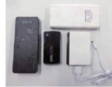
モバイルバッテリー等