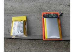
膨張・変形した電池