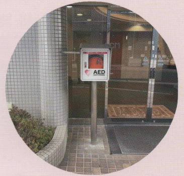
⑥ FCM(株)前 神路3-8-36