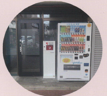
⑦ 神路1番街商店街内 (旧松本書店前)