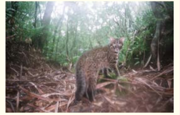
イリオモテヤマネコ

場 自然史博物館 ¥ 大人1,800円ほか 問 大阪市総合コールセンター ☎06-4301-7285 FAX06-6373-3302