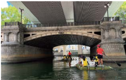
手漕ぎボート体験の様子

浄水場や下水処理場の施設見学、手漕ぎボートによる東横堀川の周遊体験を通して「水」について学びます。対象は市内在住または在学の小学生とその保護者(1組4人まで)。定員80人。昼食・飲み物は持参してください。