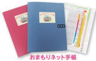
おまもりネット手帳

おまもりネット手帳・カードをすでにお持ちの方も、登録内容が古くなっていないか等、ご確認ください。発行・登録内容変更などをご希望の方は、お住まいの地域の「地域福祉活動サポーター」までご連絡ください。