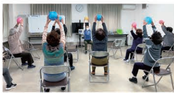
この日はボールを使った30分間の体操。呼吸や体幹を意識したピラティスのようでした!