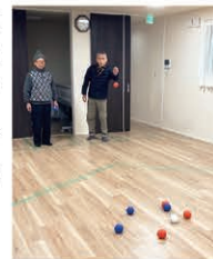
憩の家の2階にラインテープを貼り、ポッチャコート常設しています。