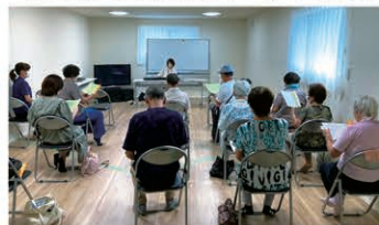
ピアノや楽器の演奏にあわせて懐かしの名曲を歌えば、心も身体もいきいき。