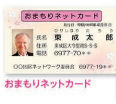
おまもりネットカード