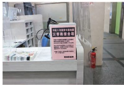
総合案内のカウンターに募金箱を設置しています。

大阪市では、令和6年1月に発生した能登半島地震災害により被災された方々を支援するため、「令和6年能登半島地震災害義援金」の受付を令和6年1月11日(木曜日)から開始しました。お預かりした義援金については、日本赤十字社を通じて、被災された方々にお届けします。