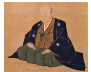
近松門左衛門像(部分)江戸時代(18世紀) 大阪歴史博物館蔵