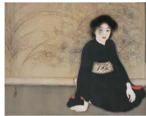
島成園《無題》大正7年(1918) 大阪市立美術館【通期展示】

場 大阪中之島美術館 ¥ 大人1,800円ほか 問 大阪市総合コールセンター ☎06-4301-7285 FAX06-6373-3302