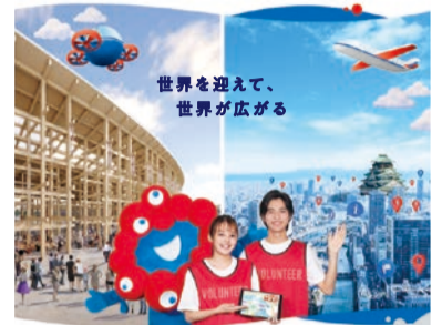
会場内での案内もまちなかでのおもてなしも

問 万博推進局参加促進課 ☎06-6690-7679 FAX06-6690-7805