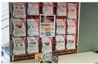
▲区役所やイベント会場等で 大阪・関西万博とSDGsのPR