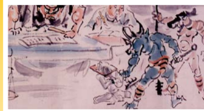
地こく変(部分) 菅橋彦筆 明治41年(1908) 大阪歴史博物館蔵

天変地異や災厄の原因を理解し、生の苦しみや死の恐怖を克服するために、人々は「異界」についてどのように捉え、交渉し、また対応してきたのかを民俗・歴史・考古・美術などさまざまな資料から考えます。 日 6/26(月)まで9:30～17:00(入館は16:30まで)、火曜休館(5/2は開館) ¥ 大人600円ほか 場問 大阪歴史博物館 ☎06-6946-5728 ☎06-6946-2662