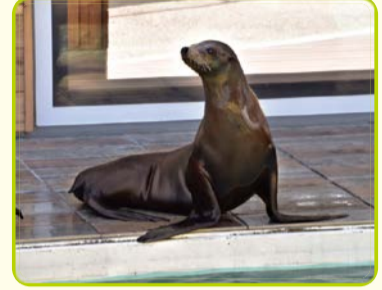
カリフォルニアアシカ