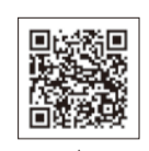
感染症についての最新情報はこちら

5月8日から感染症法上の分類が5類感染症に変わるため、検査費用の公費負担や配食サービス等は終了します。ただし、体調不良時の医療的な相談窓口や一般的な相談窓口等は引き続きご利用いただけます。また、感染時に備え、検査キットや解熱鎮痛剤、食料の備蓄等、引き続きご協力をお願いします。詳しくはQRをご覧ください。