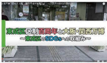
▲東成区プロモーション動画