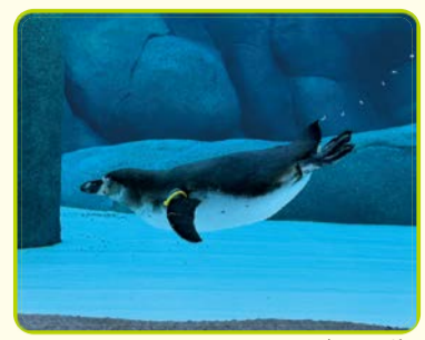
フンボルトペンギン