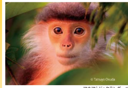
アカアシドクラングール

写真家の奥田達哉さんが東南アジアのジャングルで撮影した霊長類の絶滅危惧種の写真の中から、ユニークな約10種を20m以上にわたる壁面大型写真パネルで展示します。 日 5/12(金)まで9:30～17:00(入館は16:30まで)、月曜休館(5/1は開館) ¥ 入館料:大人300円ほか 場問 自然史博物館 ☎06-6697-6221 ☎06-6697-6225