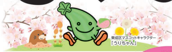
東成区マスコットキャラクター「うりちゃん」