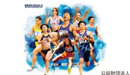
公益財団法人大阪陸上競技協会

■大会観戦 国内外のトップ選手が競う、日本グランプリシリーズの国際大会。今大会は、男女